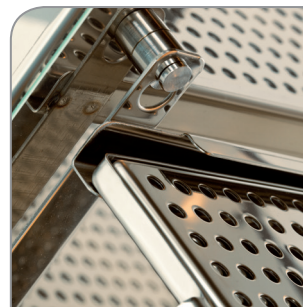
Herausnehmbares Tassengestänge für einfache Reinigung.