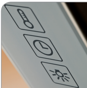
Elektronisch gesteuerte Temperaturregelung, Touchpanel und Display.