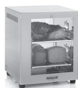
Eco Art. Nr. 710