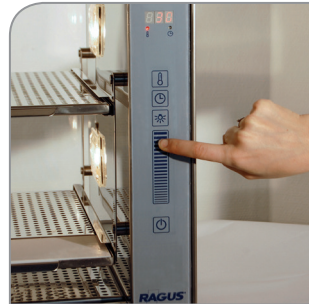
Touch-Scroll-Funktion zum Einstellen von Temperatur und Zeitvorwahl.